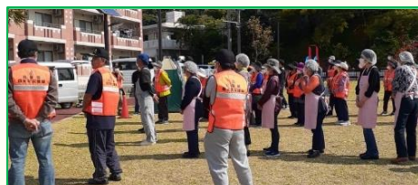
3月19日、比屋根自治会は、なごみ公園で防災訓練を行いました。約50名の地域の子どもから高齢者が参加していました。防災訓練で地域のつながりに触れることができました。