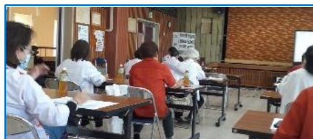
3月17日、高原公民館にて北谷町自主防災組織と美東中学校区民生委員が合同で情報交換会を行いました。