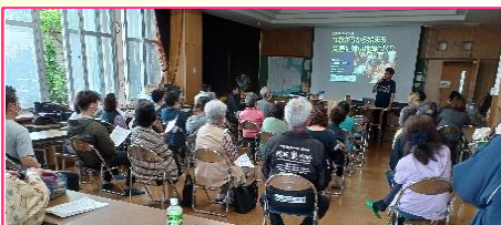
3月17日、泡瀬自治会は、防災についての講話を行いました。

出火防止・初期消火・被災者の救出・救護・避難などの防災活動を地域住民が個々に行うのは限界があります。そこで、地域住民が団結し、組織的に行動することが必要になっていきます。その為の自主的な組織こそ「自主防災組織」です。 「沖縄市 HP 防災課：自主防災組織より」